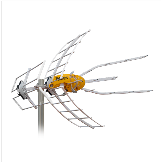
Televes förbehåller sig rätten att ändra produkten